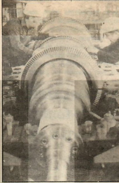
Sağlıklı kalkınma ve ekonomik büyüme yeterli ulusal teknoloji birikimiyle sağlanabilir.

tirme hedeflerini saptamak amacıyla, Başbakanlığa bağlı "Bilim ve Teknoloji Komitesi" kurulmasına girişilmiştir. Bu amaçla, Bakanlar Kurulu tarafından kabul edilen yasa tasarısı, Milli Güvenlik Konseyi'ne sunulmuş bulunmaktadır. Tasarıya göre Başbakan'ın başkanlığındaki Bilim ve Teknoloji Komitesi'nin, ilgili Devlet Bakanı ve Millî Savunma, Maliye, Millî Eğitim, Sanayi ve Teknoloji, Enerji ve Tabii Kaynaklar, Tarım ve Orman Bakanları, Devlet Planlama Teşkilatı Müsteşarı, Türkiye Bilimsel ve Teknik Araştırma Kurumu (TÜBİTAK) ve Atom Enerjisi Komisyonu Genel Sekreteri, Maden Tetkik ve Arama Ensti-