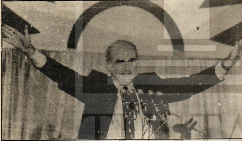
Andreas Papandreaus: Psikolojik engelleri aşabilecek mi?

ne "değişiklik" ya da Yunanca deyişle "allagi". Türkiye'nin 1974 de gerçekleştirdiği Kıbrıs Barış Harekâtından sonra yıkılan Cunta'nın ardından yapılan seçimler sürgünden henüz dönmüş olan Karamanlis'e büyük bir çoğunluk sağlamıştı. Oysa aradan geçen yıllar Karamanlis'in merkez sağ koalisyonunu yıpratmış, Papandreaun başında bulunduğu sosyalist