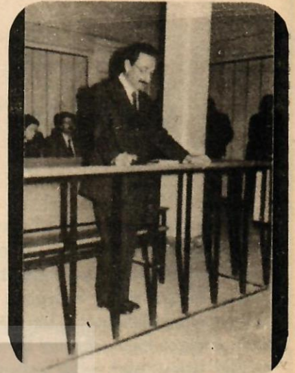
Bülent Ecevit: Yargılandı.