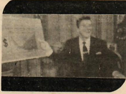
EKONOMİ: ABD'nin tutumu