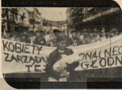
"Sosyalizmin amacı aç çocuklar yaratmak mı?"