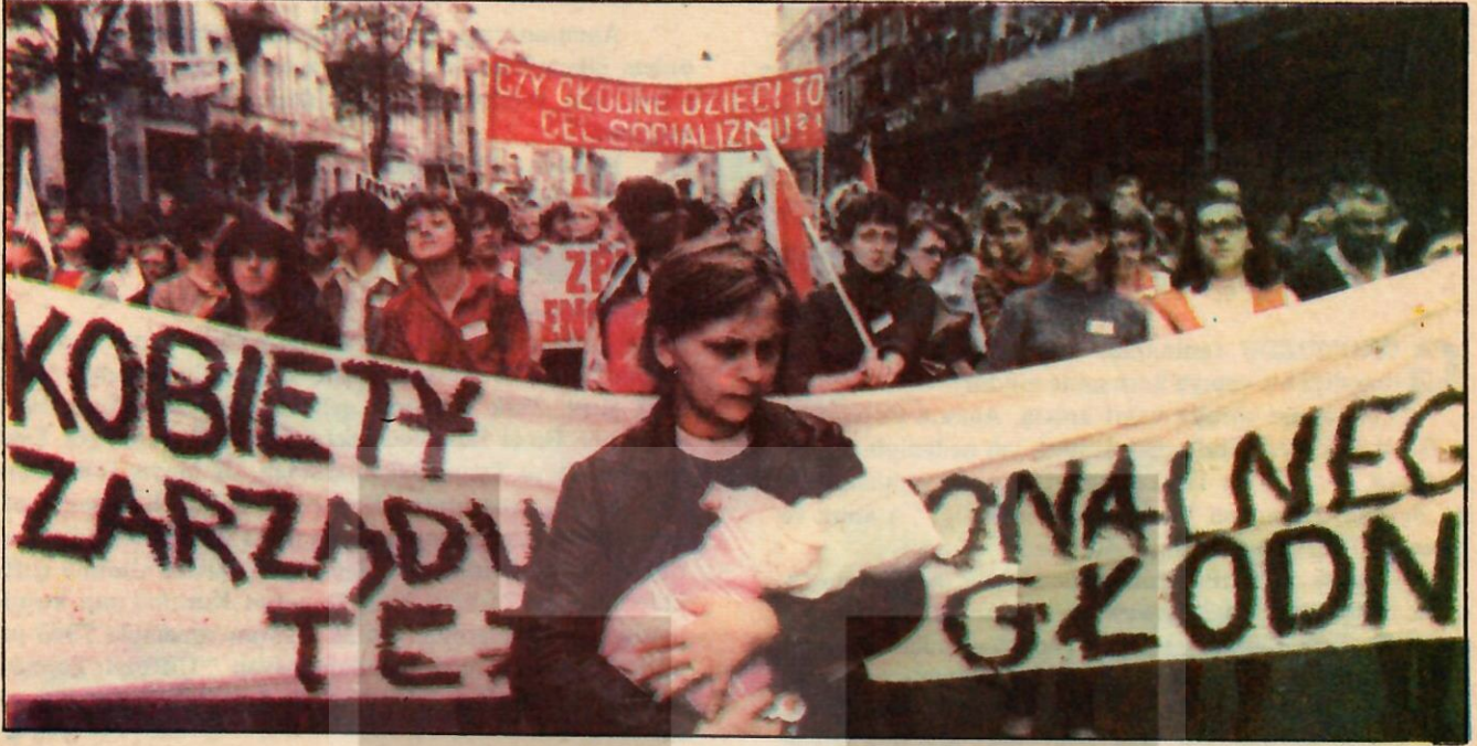
"Kendimizi kendimizden korumalıyız"

B U sözler, önderliğini yaptığı Dayanışma Sendikası içindeki 'aşırı' unsurlara, Lech Walesa'nın söylediği sözler: Geçen haftaki ilk Dayanışma Kurultayında yeniden başkan seçilen Walesa, orada da, yüzde 55'le seçildiği belli olduktan sonra şöyle demiş: